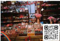
和倉昭博物館と おもちゃ館 ☎0767-62-1161 ※当館の週、土・日・祝日営業