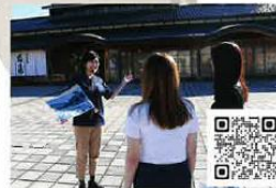
和倉温泉復興ツアー ☎0767-62-1555 ※要予約