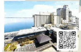
TAOKA和倉 (旧湯快リゾート金波荘) ☎050-3615-3456